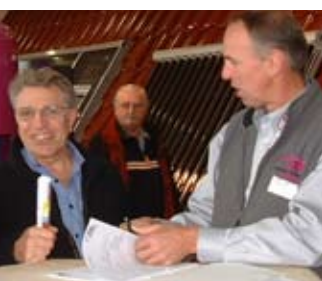
Vermittlung von Interessenten