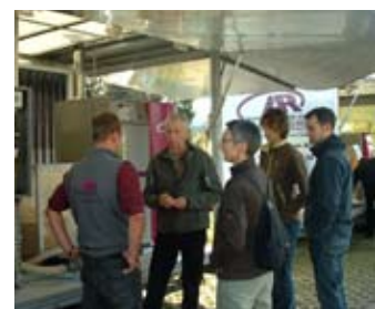
5 verschiedene Ausstellungshänger für Ihre Hausmesse