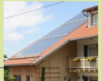
Installationshilfe bei Großflächenkollektoren