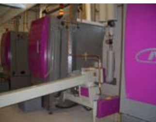
Realisierung kleiner Nahversorgungsnetze