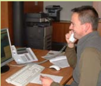
Techniker als Ansprechpartner