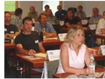
Schulungen in hauseigenen Räumen