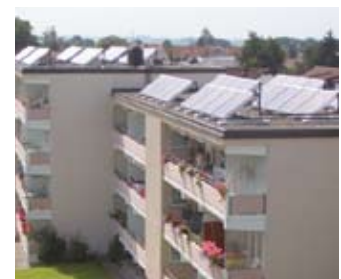
Planungsunterstützung bei Großprojekten

Speichertechnik, Frischwasserstation, Zubehör