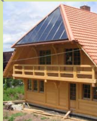
Unterstützung bei Sonderanfertigungen

Gemeinsam beim Endkunden punkten - mit Qualität, Kompetenz und Service!