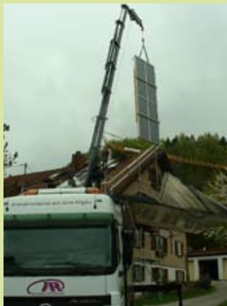
Bereitstellung eines Großkrans